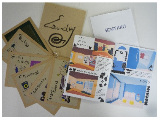
学生からの提案例 1

当社は、今後も積極的に産学連携プロジェクトへの参画を図っていくとともに、良質な賃貸住宅の提供に取り組んでまいります。