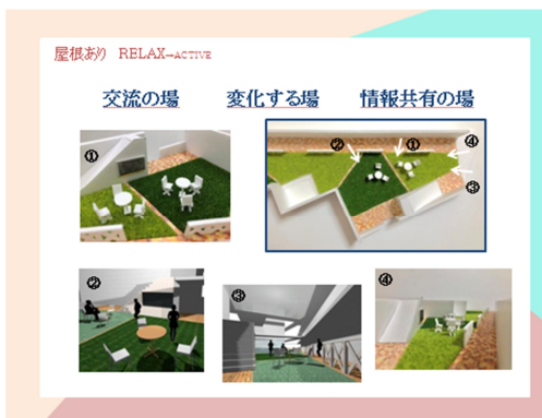
学生からの提案例 2